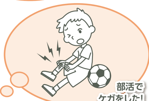
部活で ケガをした!