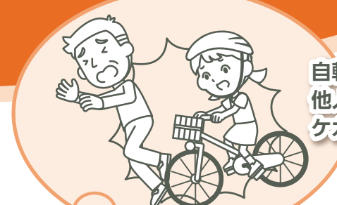
自転車で 他人に ケガをさせた!