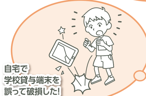
自宅で 学校貸与端末を 誤って破損した!